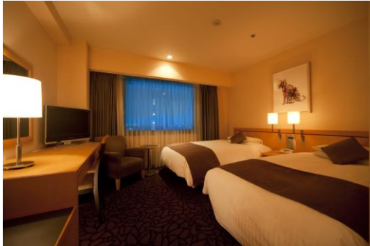
●スーパーアツイン／21㎡ ￥26,000(2名)11室