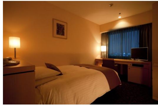
●スーパーシングル／17㎡ ￥17,000(1名)24室