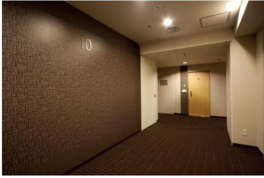
●スーパーアフロア 9・10F