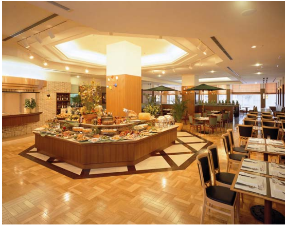
1F ブッフェレストラン「ミケーラ」