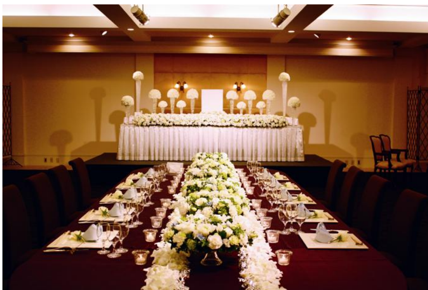
法要会食(展示会場イメージ)

浦和ロイヤルパインズホテルの法要会食件数は、2009年度、2010年度とほぼ30件ペースで推移しておりますが、本年2月より定期的に「法要内覧会」を実施することで、2011年度は、倍増の60件の受注を目指します。(2011年度は8月までに25件の法要会食を受注しています。)