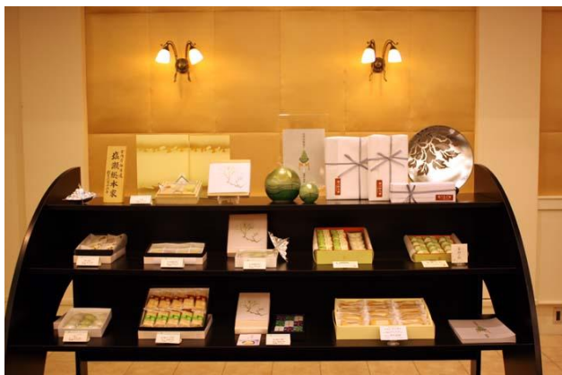
返礼品展示コーナー

【来場特典】今回の「法要内覧会」にお越しいただいたお客さまには、宴会場での法要ご利用時に、会場料、返礼品、装花、ご宿泊が割引となる割引券をさしあげます。