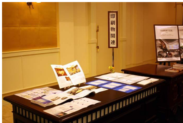
印刷物関連展示コーナー